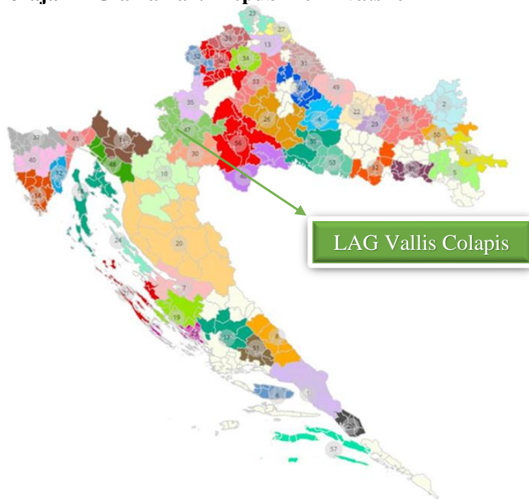
Slika 2: Karta položaja LAG-a na karti Republike Hrvatske