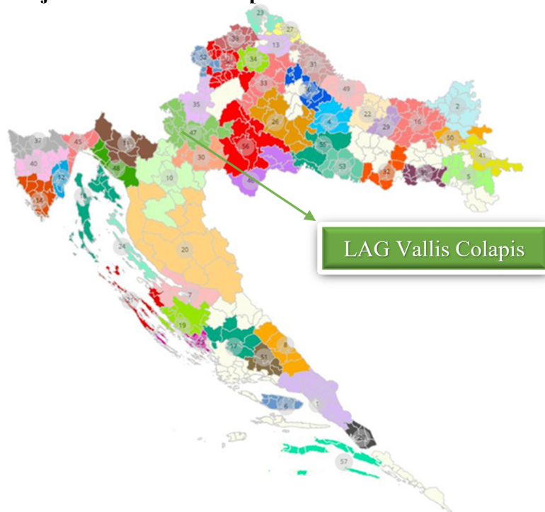
Slika 2: Karta položaja LAG-a na karti Republike Hrvatske